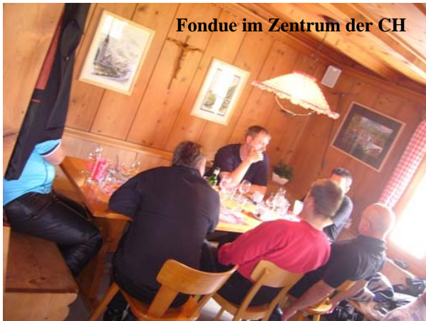
Fondue im Zentrum der CH