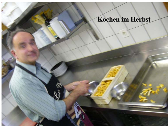
Kochen im Herbst