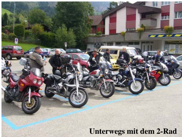
Unterwegs mit dem 2-Rad