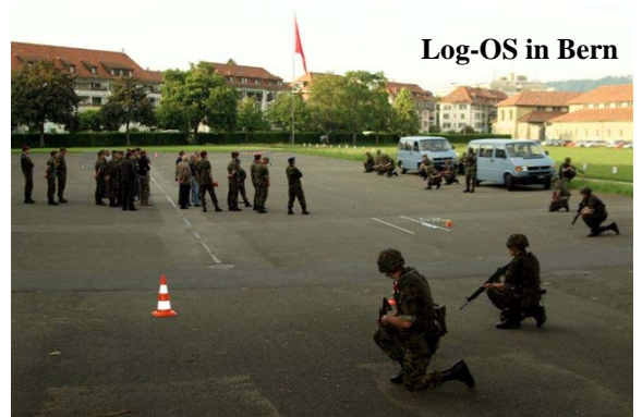
Log-OS in Bern