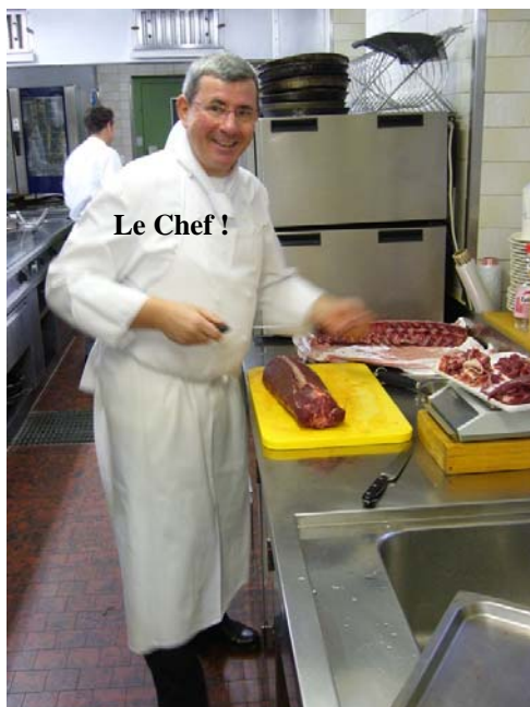
Le Chef !