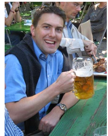
Sebu sagt: Prosit Kameraden!