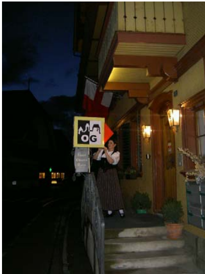
Willkommen in Sumiswald !