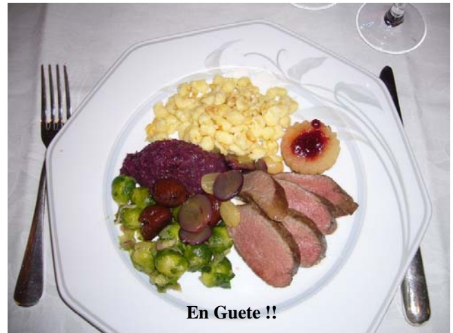
En Guete !!